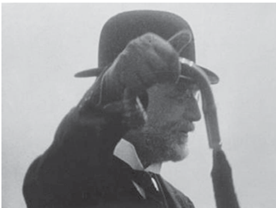
Эрик Сати в прологе «Relâche»