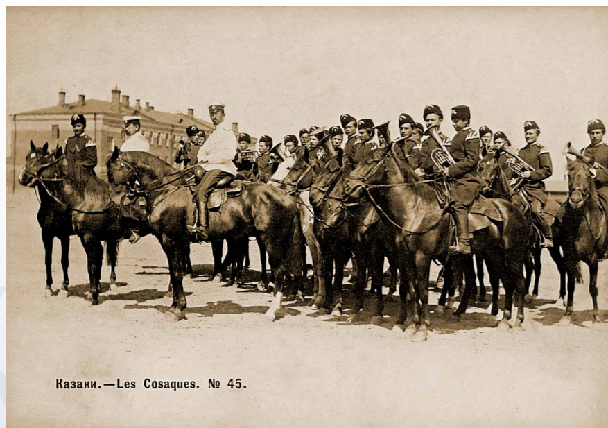
Казаки. — Les Cosaques. № 45.