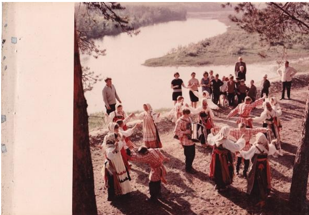
Приложение 16. Оркестр. Фотография 1972 года. Суджанский краеведческий музей. Госкаталог.