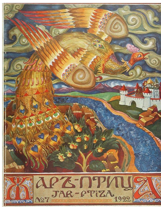
Г. Шлихт. Обложка журнала «Жар-птица», 1922 № 7

«Зачарованное царство» проникнуто художественными идеями модерна, прежде всего – эстетической категорией красоты. Воплощением культа красоты становится образ прекрасной мифической «Жар-птицы» – это не просто сказочный персонаж, а многозначный символ в эстетике модерна.