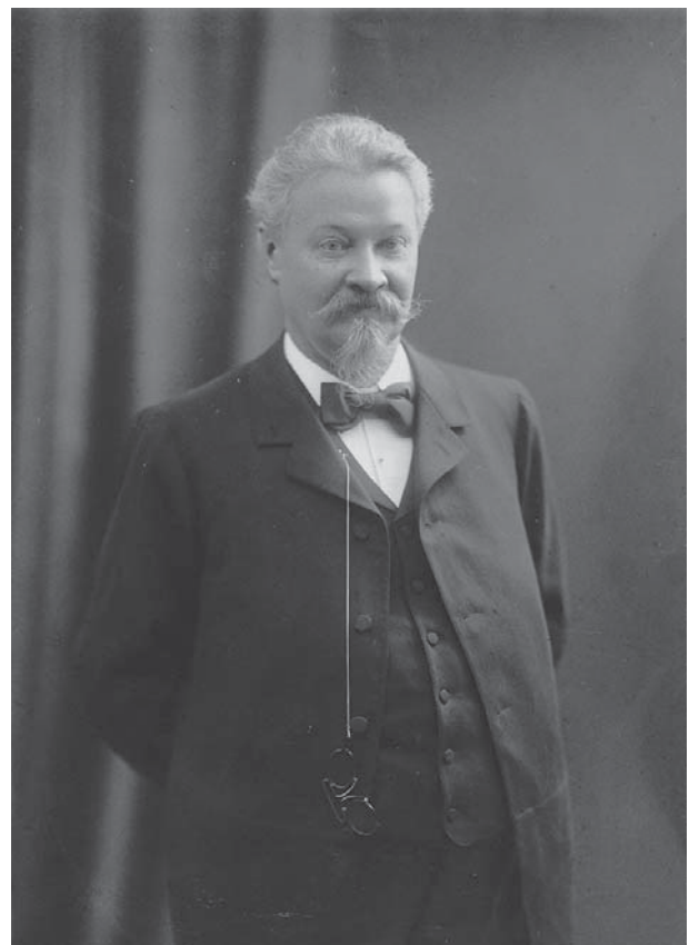
Мартин Вегелиус (1846–1906)

Типичным примером является биография Мартина Вегелиуса (Martin Wegelius, 1846–1906) , композитора, дирижера, критика, основателя нескольких учебных заведений в Хельсинки (в том числе музыкального института), общественного деятеля.