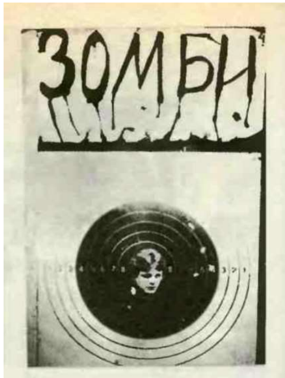
Иллюстрация 1. Юрий Антонов на обложке журнала «Зомби» (1985. № 4).

«Урлайт» был еще одним весьма засекреченным московским журналом. В 1985 году он появился как продолжение «Ухо» и был посвящен контркультуре в целом. В основном разделе – «Рок-хроника» – публиковались интервью, репортажи с концертов, обзоры альбомов. «Урлайт» можно считать ярким примером усиленной конспирации в редакциях – статьи нередко печатались на разных машинках, подписывались уникальными неповторяющимися псевдонимами. Во избежание проведения стилистической экспертизы материалы переводились сначала на английский язык, а потом снова на русский. Фотографии страниц журнала перевозили по стране в пакетах от молока.