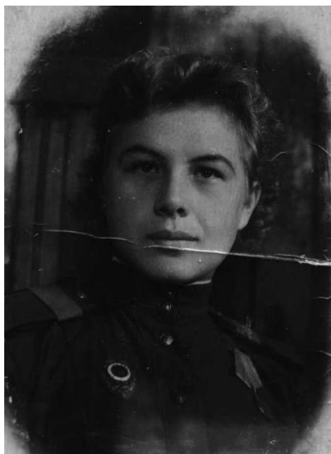
Фотография 1943 года