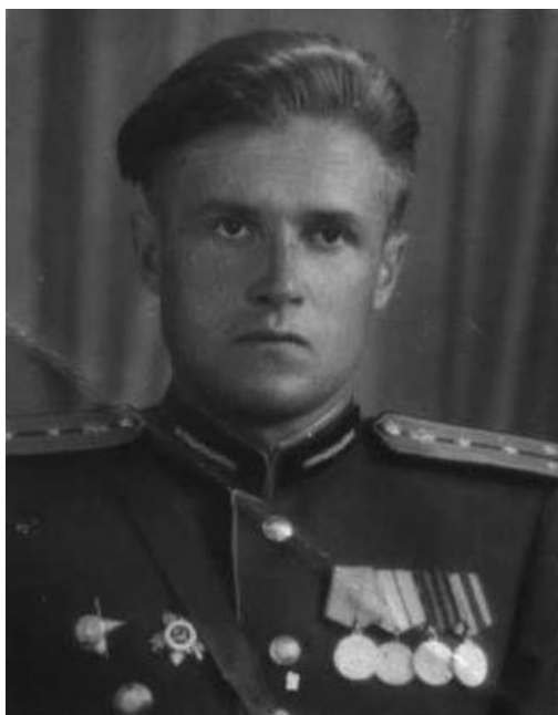
Фотография 1945 года