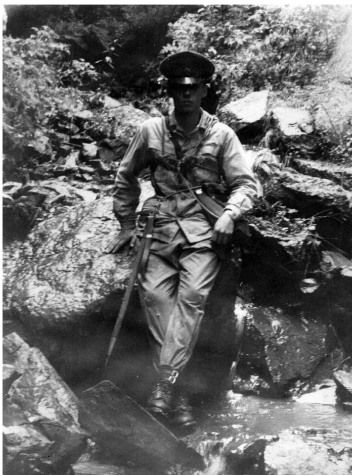
Это фотография 1984 года.

Напоследок прикрепляю несколько фото своего отца, которого я очень люблю: