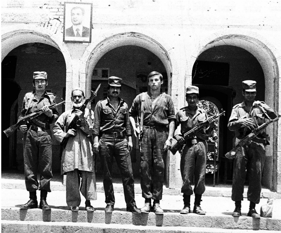
А эта 1985.