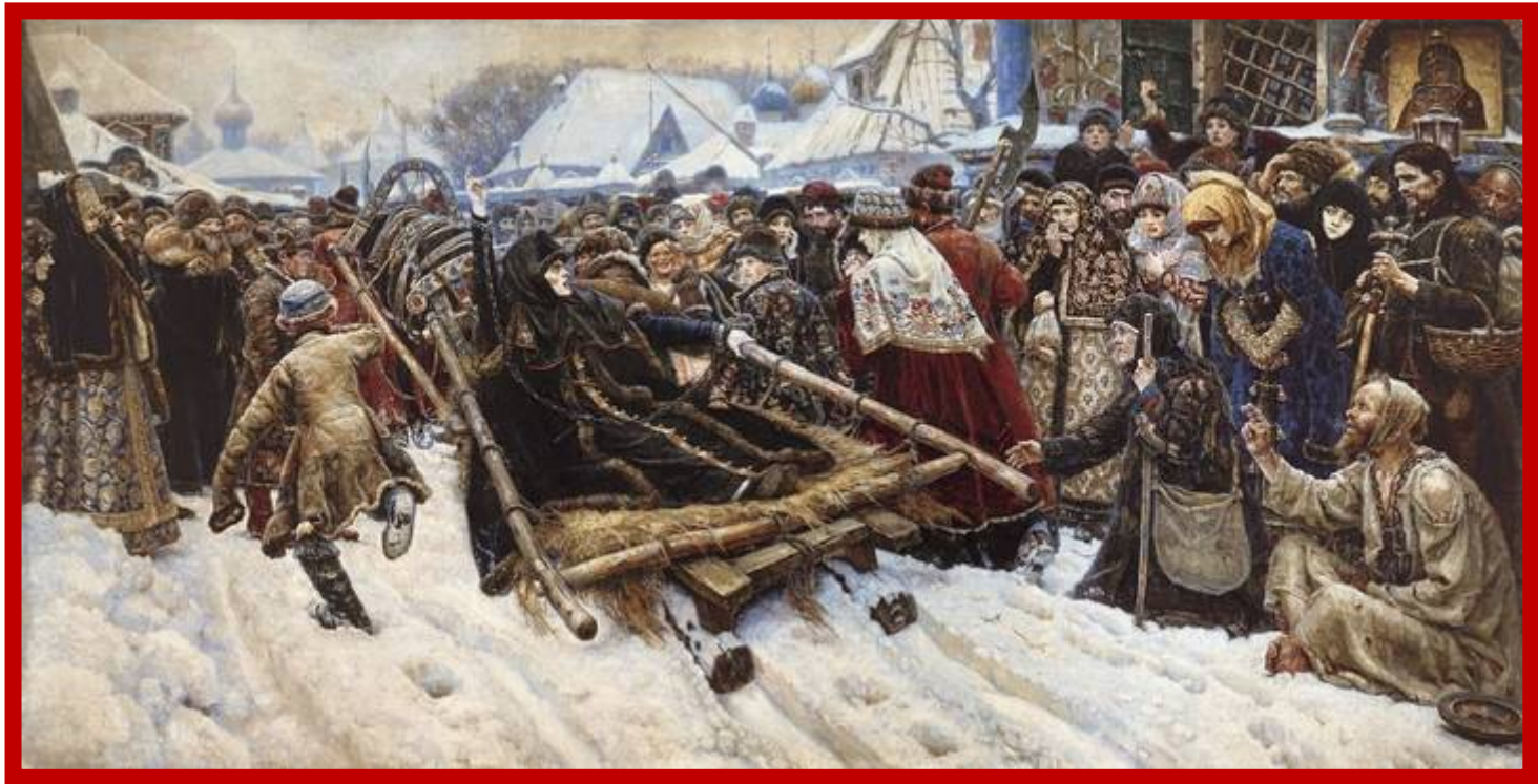
Суриков В.И. Боярыня Морозова.