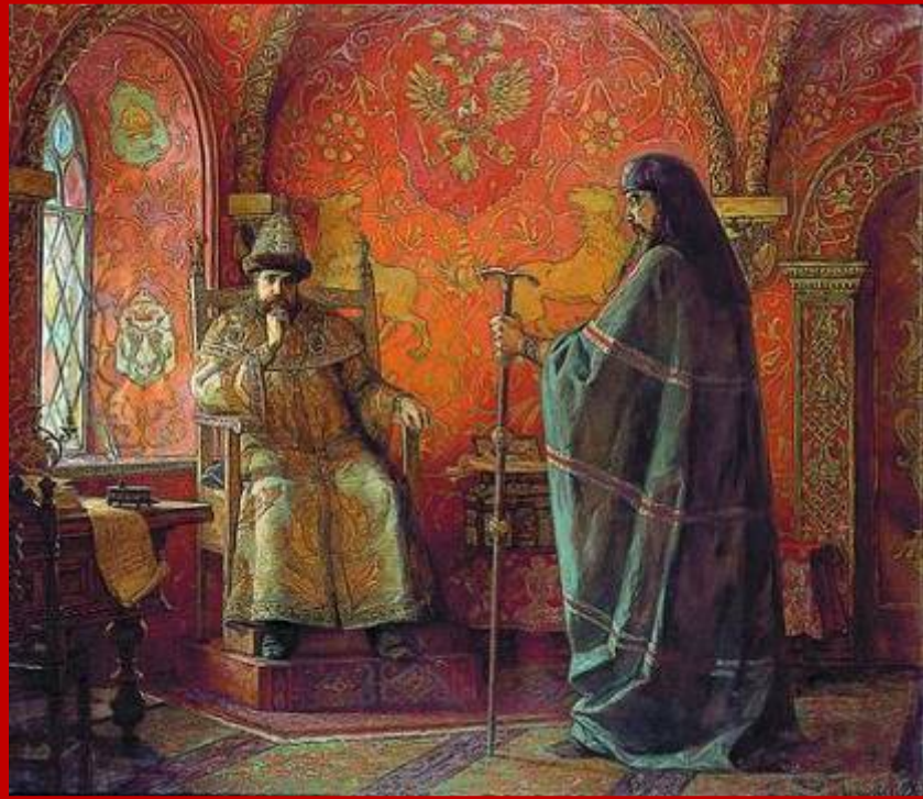
"Царь Алексей Михайлович и Патриарх Никон"