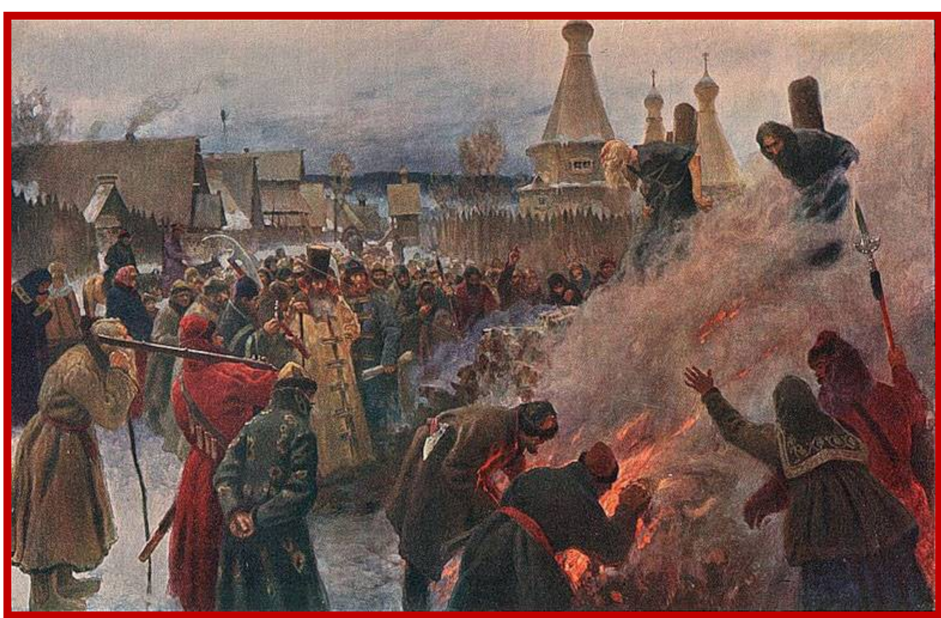
Григорий Мясоедов. "Сожжение протопопа Аввакума".