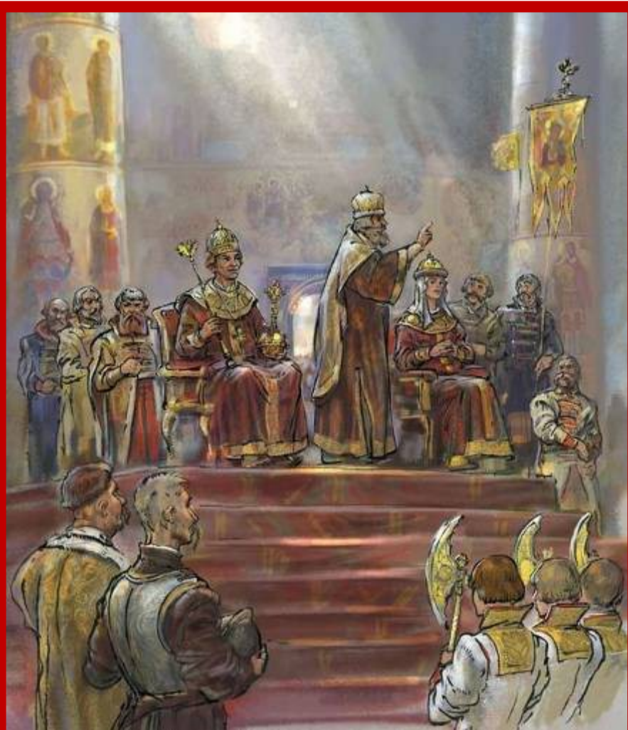
Венчание на царство Марины Мнишек