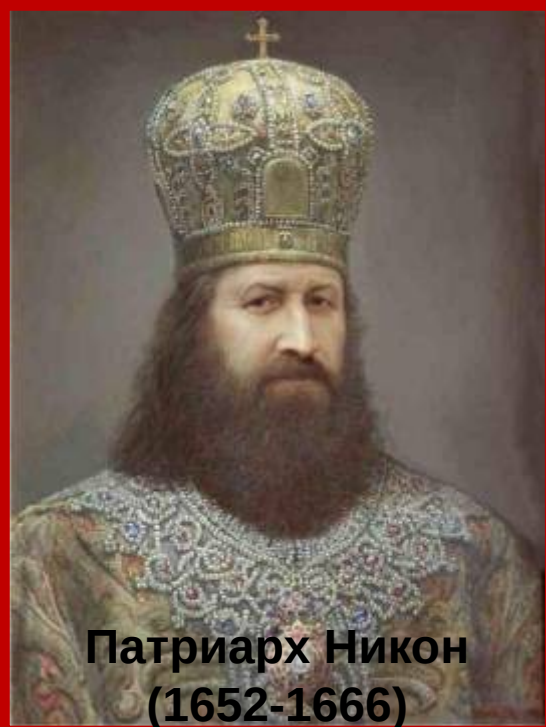
Патриарх Никон (1652-1666)