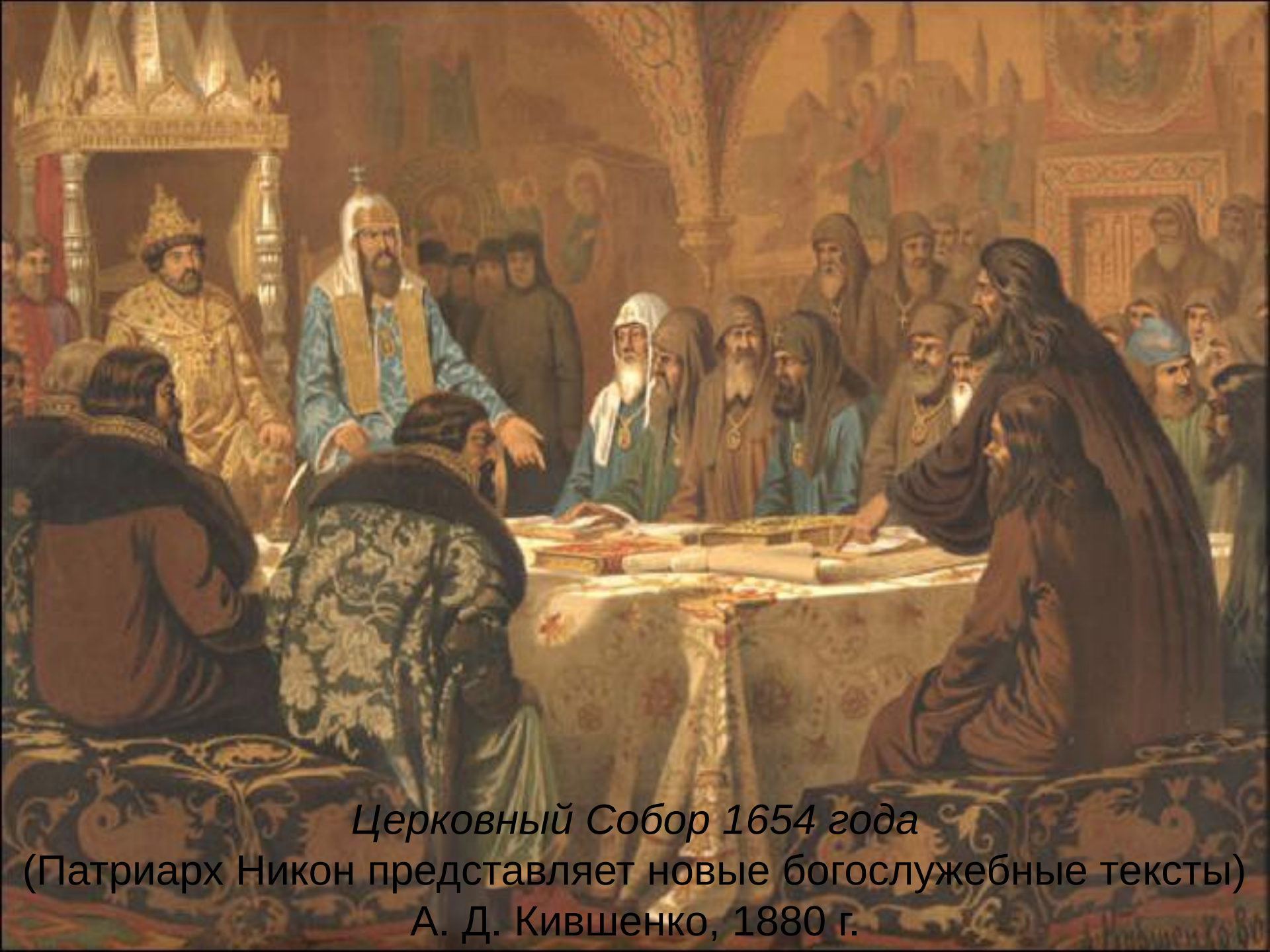
Церковный Собор 1654 года (Патриарх Никон представляет новые богослужебные тексты) А. Д. Кившенко, 1880 г.