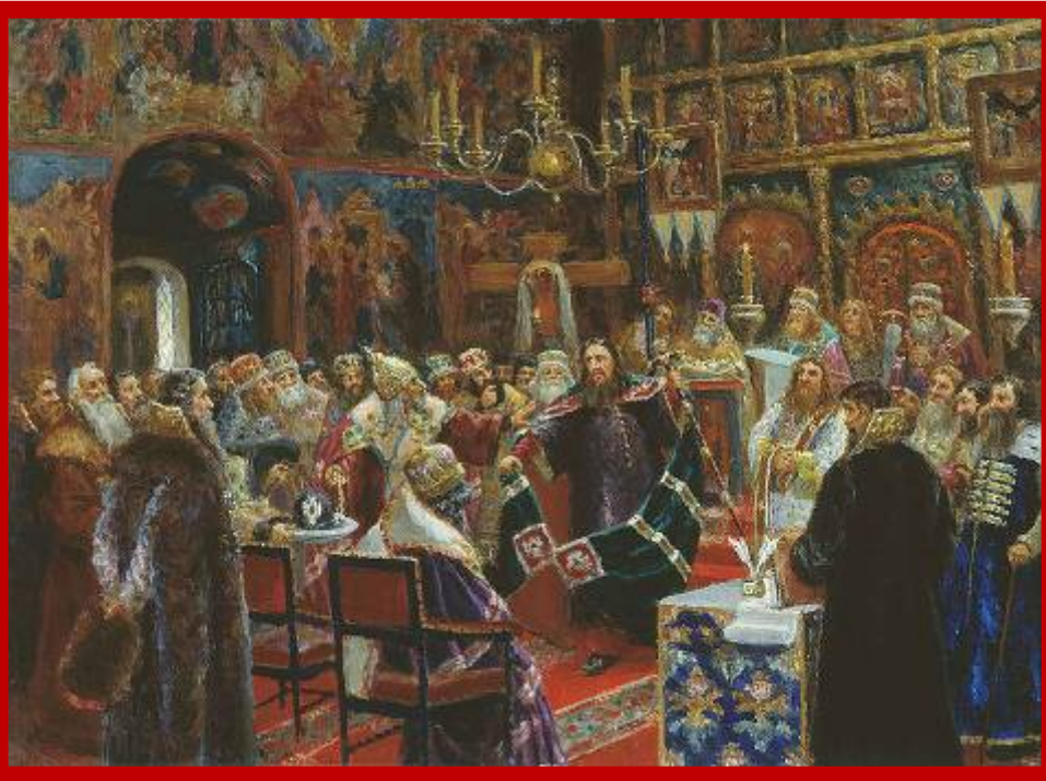
Суд над патриархом Никоном (С. Д. Милорадович, 1885 год)