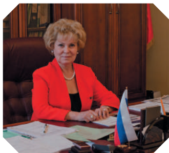
格涅辛音乐学院总统， 俄罗斯联邦艺术功勋活动家， 俄罗斯联邦政府奖金的获奖者， 教育科学副博士， 教授 - 加林娜·瓦西里耶夫娜· 马亚罗夫斯卡娅