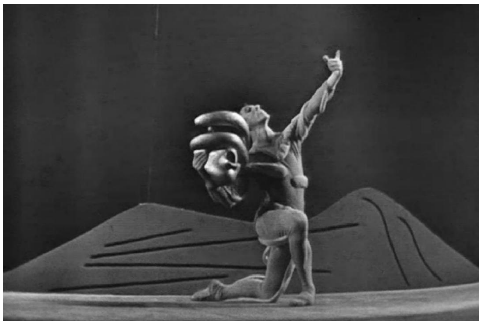
Пример 27. Кадр из постановки 1960 года. New York City Ballet

Эта аллегорическая фигура была весьма популярна в римской литературе, в том числе в произведениях Вергилия и Овидия: